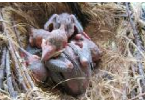
Si les œufs éclosent tous, il est rare que tous les jeunes survivent car les aînés prendront l'avantage sur les cadets.

veste et lunette de protection, avec certains couples une relation de confiance s'instaure, et lorsqu'un jeune a un problème, à ce moment là, j'ai libre accès au nid.