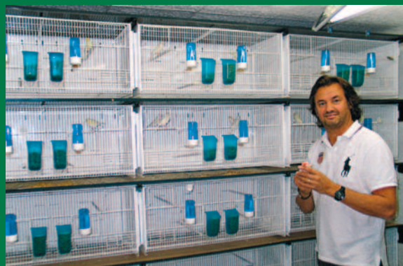
Cilea: exemple de composition d'un élevage à 4 étages de 5 colonnes avec cages Cilea 90x40x40 cm disposées sur chariot monofront

Elevage de Monsieur Claude Micallef Ver Sur Launette - France