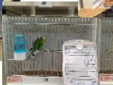
À gauche la Meilleure ondulée de couleur avec 94 points !