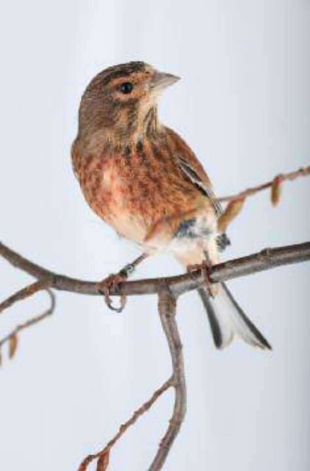
Linotte mélodieuse [© Philippe Rocher - El. Antoine Salvador]