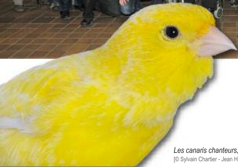
Les canaris chanteurs, une spécialité de la région.