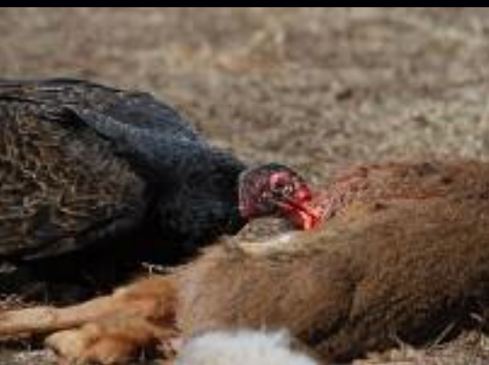
Urubu à tête rouge ( Cathartes aura ) mangeant une carcasse de chevreuil.

Certaines plantes ne restent pas passives lors de la pollinisation : dans la famille des axinés, les fleurs attirent des oiseaux puis les aspergent de pollen. Un comportement qui a été décrit dernièrement dans la revue Current Biology . Les axinés se présentent sous la forme d'arbustes buissonnants dans les zones montagneuses d'Amérique Latine. Lorsque des oiseaux viennent se nourrir, ils se font bombarder de pollen par des organes en forme de soufflet. Et quand les oiseaux se posent plus tard sur une fleur femelle, ils la fécondent au passage. Une évolution conjointe : "ce système de pollinisation est aussi unique que complexe. Il est complètement nouveau pour la science et fournit un nouvel exemple des relations d'intrication qui se sont développés entre les fleurs et leur pollinisateur au cours de l'évolution", explique Agnès Dellinger de l'université de Vienne. "La majorité des fleurs pollinisées par des oiseaux offrent du nectar en récompense, dans les rares cas où elles proposent de la nourriture solide, ces tissus sont limités à la partie extérieure, et stérile, des organes floraux, ils ne sont jamais sur les organes reproducteurs", poursuit-