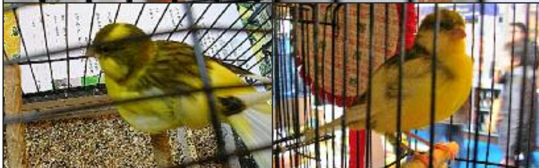
N°5 Canari Border