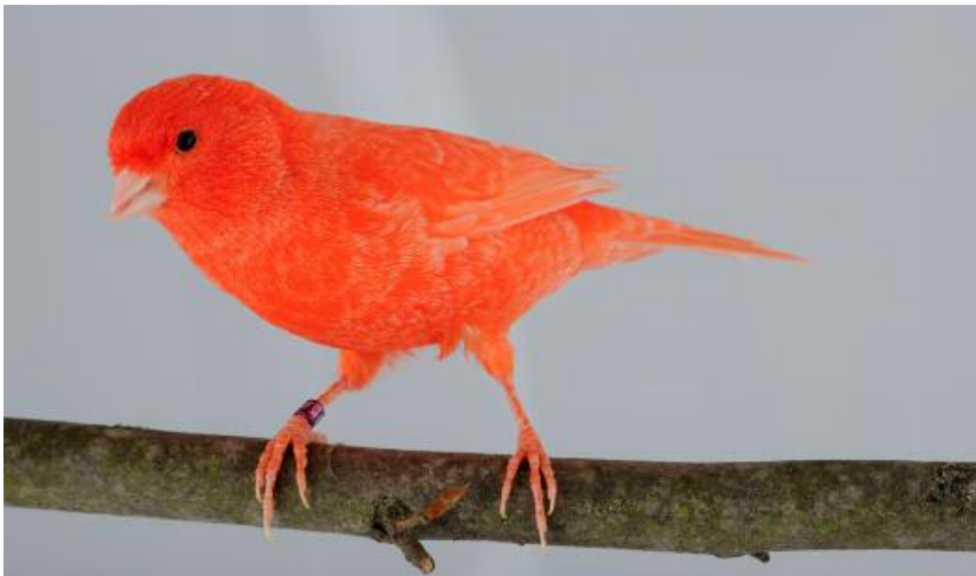
Canari rouge schimmel [© Philippe Rocher - El. Roland Claus]