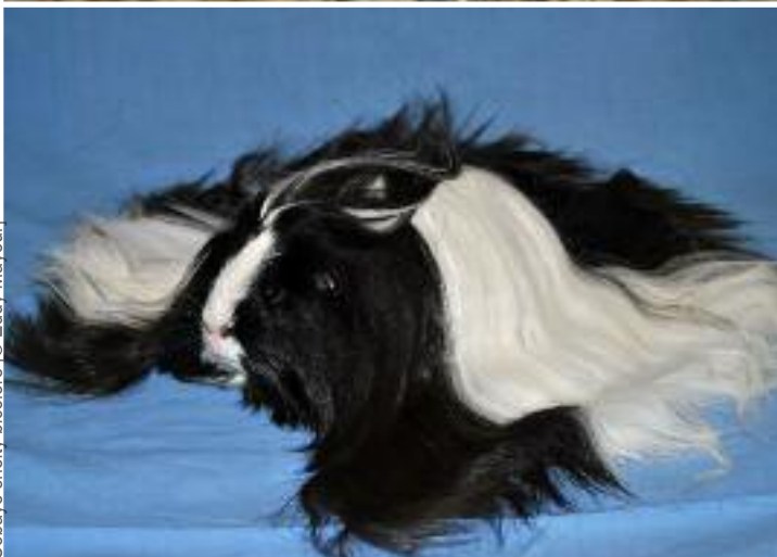
Cobaye sheltie bicolore