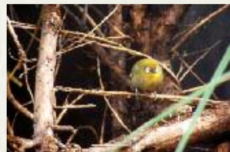
Ci-dessus Zosterops spp.