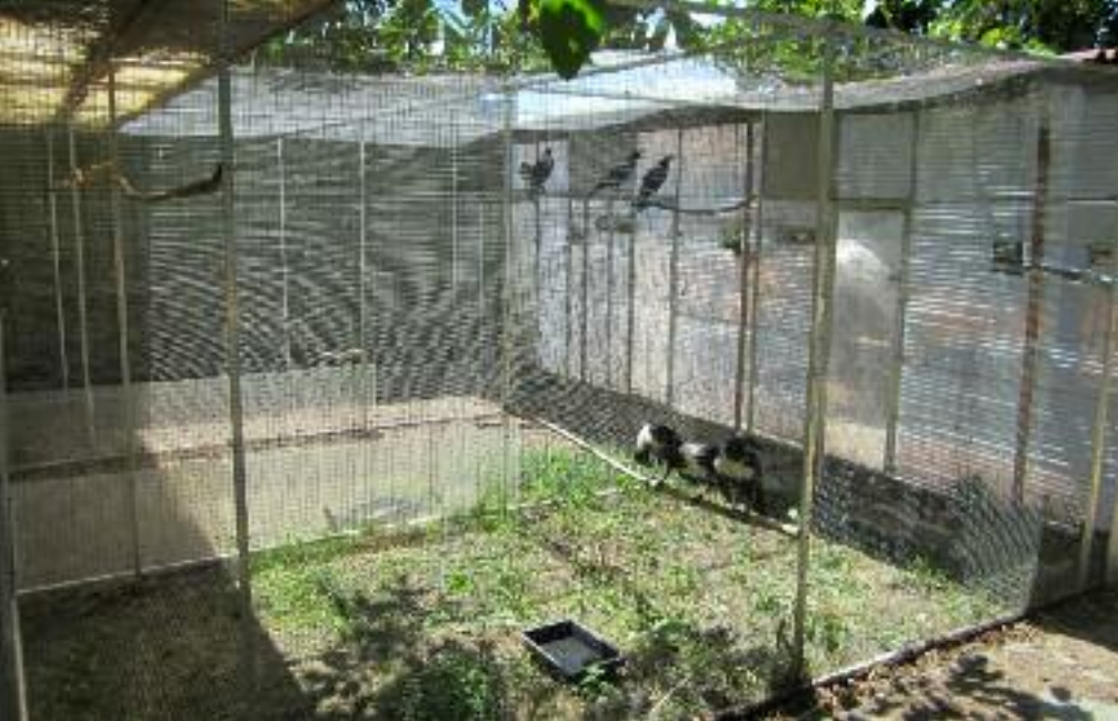
Des volières spacieuses et ensoleillées sont nécessaires pour l'élevage du Corbeau pie.