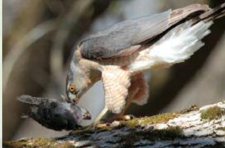
Faucon de Cooper ( Accipiter cooperii ) faisant d'un étourneau son déjeuner.

Les mammifères, surtout les rongeurs, peuvent être réservoirs ou vecteurs d'agents pathogènes redoutables. Citons, à titre d'exemple, le cas de la