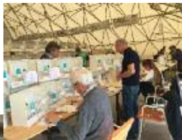
Jugement des Diamants de Gould par les juges italiens.