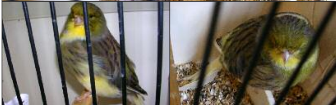
N°2 Canari Gloster consort