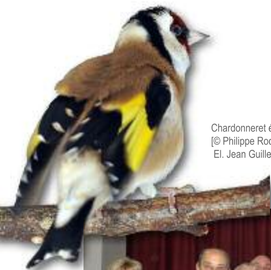
Chardonneret élégant