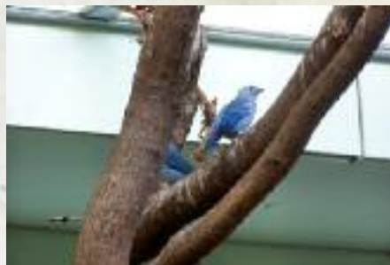
Ci-dessus Tangara évêque ( Thraupis episcopus )

Des adaptations botaniques sont apparues sur certaines fleurs : ainsi, tant qu'une fleur de Centropogon n'est pas visitée par un colibri, ses étamines sont orientées vers le bas ; lorsqu'un colibri vient prélever le nectar, son crâne heurte les étamines et se couvre