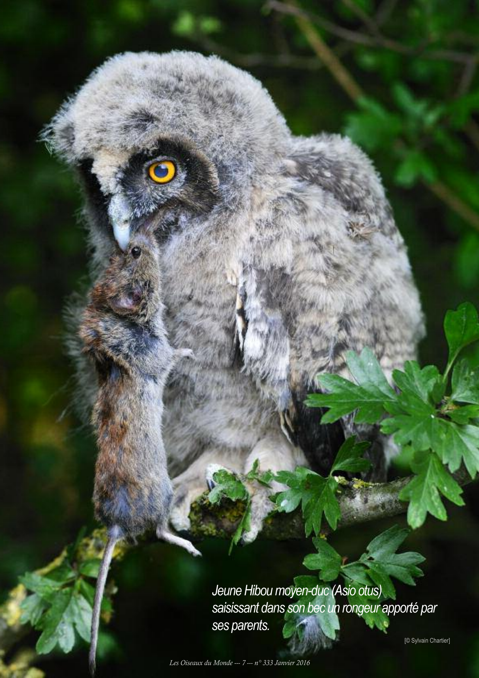
Jeune Hibou moyen-duc (Asio otus) saisissant dans son bec un rongeur apporté par ses parents.