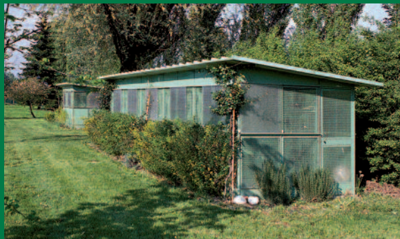
Paganini: Volière modulaire pour extérieur préfabriquée pour oiseaux. Exemple de réalisation d'une volière Paganini composée par 10 box de 80x160 cm et couloir de service de 80 cm