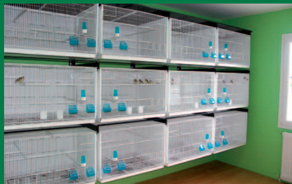
Cilea: exemple de composition d'un élevage à 3 étages avec cages Cilea de 80x60x50 cm disposées à parois et avec nettoyage papier

Elevage de Monsieur Bernard Eloc Harnes - Pas De Calais - France