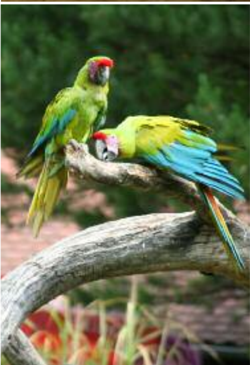
Ci-dessus Ara rouge ( Ara macao ) et ci-contre un couple d'Ara de Buffon ( Ara ambiguus ).