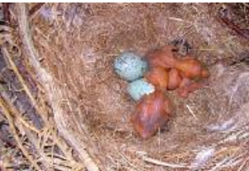
Les éclosions surviennent au fil des jours ce qui crée un décalage dans la croissance des oisillons.