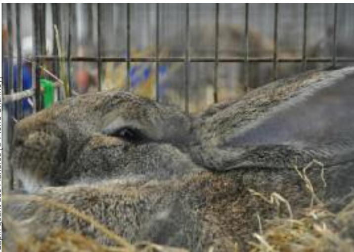
Lapin géant des Flandres