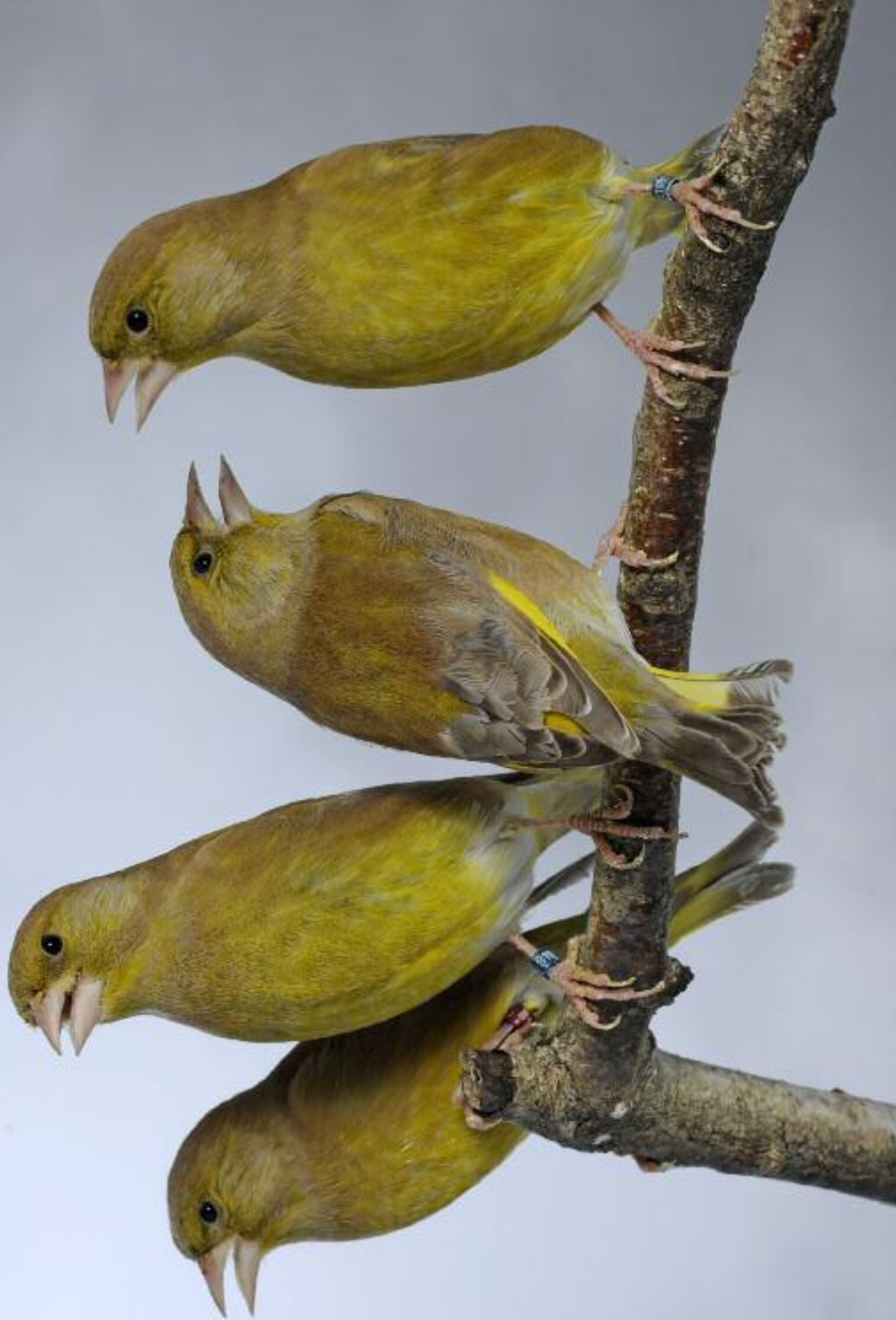
Stam de Verdiers d'Europe brun