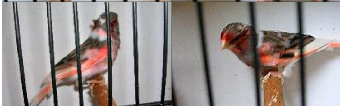
N°4 Canari Arlequin portugais non huppé