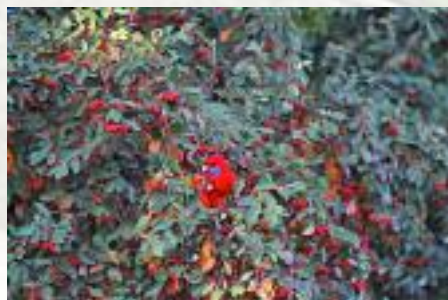
Perruche de Pennant se délectant de baies rouges dans un parc australien.

• Une 4 e catégorie de mode de dissémination des graines est encore plus complexe : la semence est ingérée avec le fruit et passe ainsi à travers le tube digestif de l'oiseau. La pulpe et les substances nutritives sont assimilées tandis que les graines sont rejetées avec les fèces. On peut se demander si le passage à travers le système digestif n'altère pas les facultés germinatives des graines : bien au contraire, il les favorise car il attaque les enveloppes dures et coriaces. L'exemple le plus classique est celui de l'étrange association qui existe à travers le monde entre les guis et divers oiseaux, et qui varie d'une région à l'autre en fonction de leur avifaune spécifique. En Europe occidentale, l'espèce la plus représentative est la Grive draine ( Turdus viscivorus ).