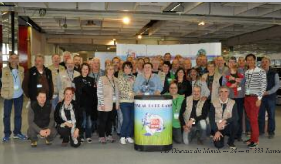
l'équipe des bénévoles du concours EE section Oiseaux.