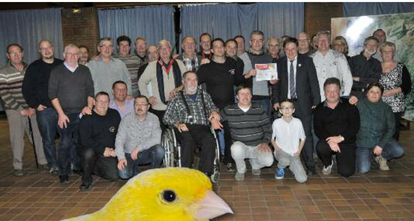
Les bénévoles de la région 08 à la soirée de gala du National de Gravelines 2013.