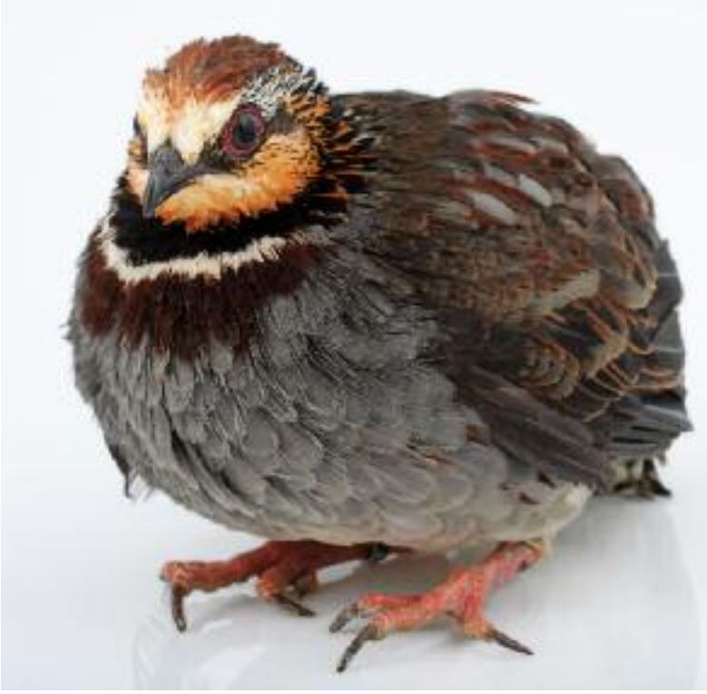
Torquéoole de Sonnerat