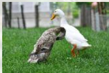
Très sensibles aux virus, les canards peuvent servir de vecteur de transmission à l'homme...

Du fait de leurs exceptionnelles facultés de déplacement (déplacements rapides sur de grandes distances, c'est le cas notamment des espèces migratrices, parmi lesquelles certaines vont d'un continent à un autre voire d'un pôle à l'autre), les oiseaux jouent un rôle notable dans la diffusion de virus très divers, ce qui a récemment fait l'objet de nombreux travaux. De plus, au cours de leurs migrations ou de leur hivernage, les oiseaux se tiennent en troupes considérables, ce qui facilite la transmission d'un individu à un autre. Enfin beaucoup, tels que les canards et les petits échassiers ou limicoles, vivent dans des milieux aquatiques favorables à la transmission des agents pathogènes.