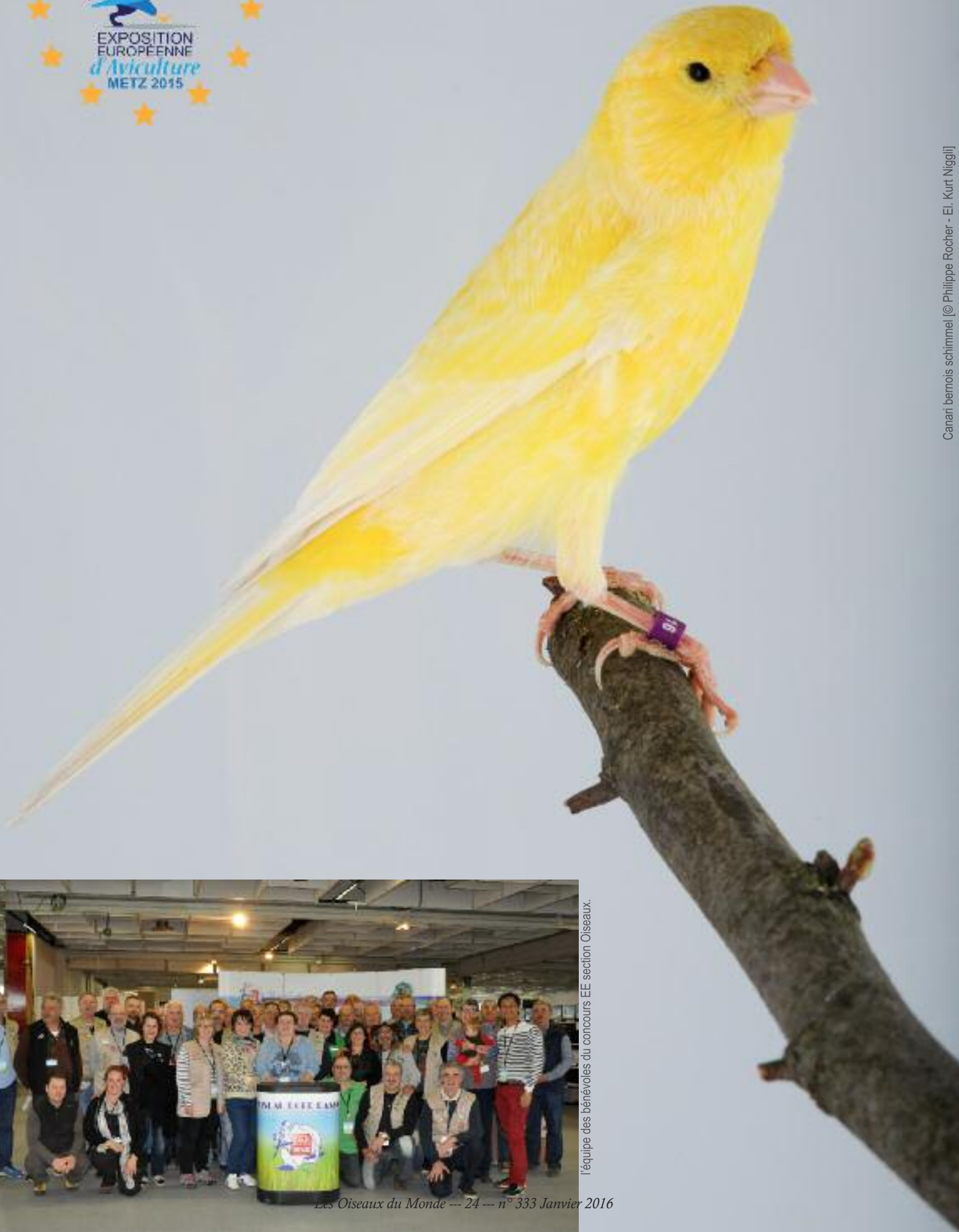
Canari bernois schimmel [© Philippe Rocher - El. Kurt Niggli]