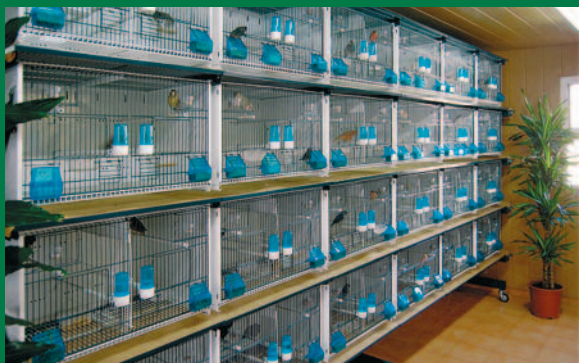
Cilea: exemple de composition d'un élevage de cages Cilea 60x40x40 cm pour psittacides à 4 étages de 6 colonnes avec nettoyage papier disposé sur chariot

Elevage de Monsieur Miguel Payzo Rodríguez - Roquetas de Mar - Almería - Espagne