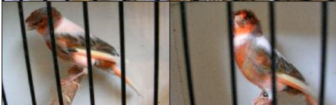
N°3 Canari Arlequin portugais huppé