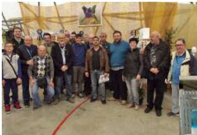
L'équipe organisatrice de la Fenice 2015.