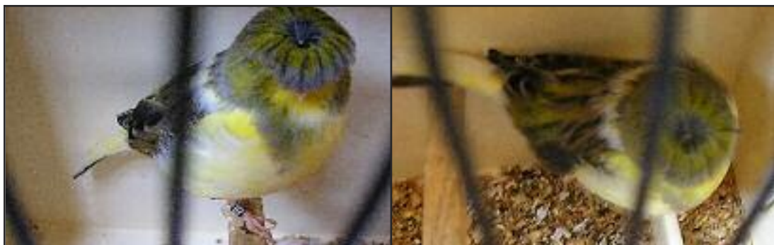
N°1 Canari Gloster corona