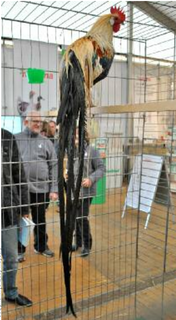
Cocq phénix