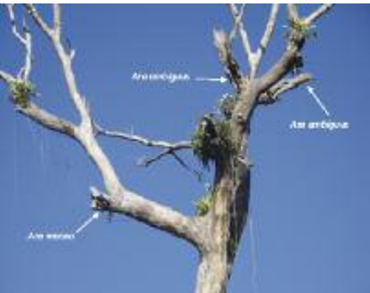
L'arbre «immeuble» abritant deux espèces différentes d'Ara pour un total de trois familles !

En juin 2011, Adolfo Gonzalez, manager de Laguna Del Lagarto Lodge a découvert un Almendro à 100 mètres de l'orée d'une forêt naturelle dans une clairière d'un diamètre d'environ 1000 mètres ayant 2 nids actifs d'Aras de Buffon et un nid actif d'Aras rouges. Les chercheurs (Chassot et al. 2011)*ont confirmé cette découverte à l'issue de leur visite en avril 2011. Ils ont trouvé l'arbre, d'une hauteur approximative de 45 mètres, détérioré, avec un grand nombre de cavités dans lesquelles plusieurs couples de Aratinga finschi avaient nidifié. Les deux nids d'Aras de Buffon furent trouvés à 23 et 24 m de hauteur et celui des Aras rouges à 21 m. Le comportement des aras adultes montrait que le couple de Aras rouges élevait des petits alors que l'un des couples de Aras de Buffon vivait avec ses jeunes et que l'autre couvait des œufs. Aucun des couples ne montrait la moindre hostilité envers les autres. Dans des études précédentes des chercheurs ont observé des Almendro comportant des nids actifs de Ara de Buffon mais jamais avec des couples d'Ara de Buffon et d'Ara rouge.